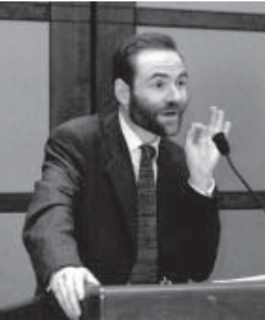
Timothy Garton Ash

Jedes Jahr lädt das IWM seine Fellows, Mitarbeiterinnen und Mitarbeiter, Freunde und Förderer zu einem informellen Treffen ein. 2004 hielt der Historiker Timothy Garton Ash den Eröffnungsvortrag. Er ist Direktor des European Studies Centre am St. Antony's College, Oxford University, und Mitglied des Wissenschaftlichen Beirats des IWM.