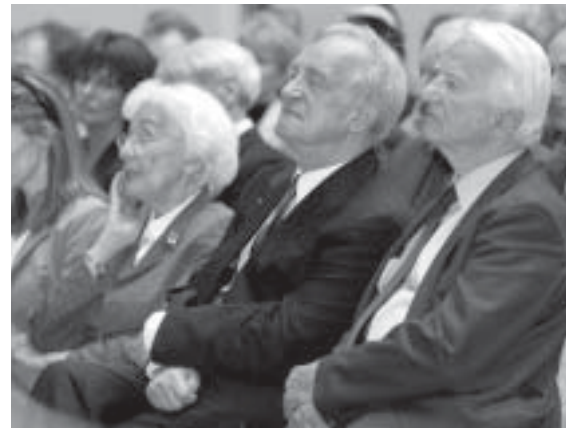
Hildegard Hamm-Brücher, Johannes Rau, Richard von Weizsäcker