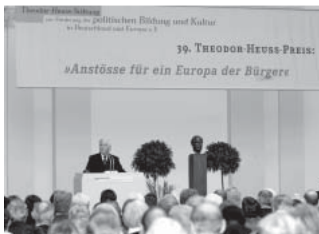
Kurt Biedenkopf hält seine Laudatio