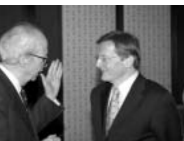
Lord Dahrendorf, Wolfgang Schüssel