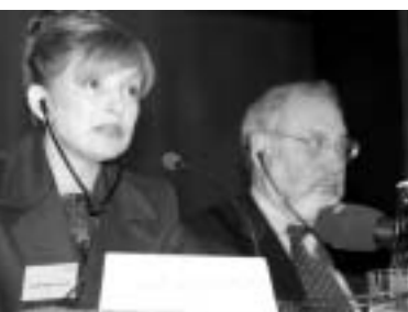
Julija Tymoshenko, Joseph Stiglitz