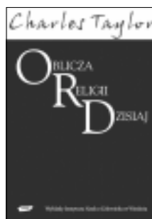
Charles Taylor Oblicza religii dzisiaj Cracow: Znak 2002

IWM Lectures in Human Sciences are jointly published with Harvard University Press, Suhrkamp Verlag (Frankfurt a.M.) and Znak Publishers (Cracow)