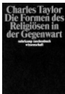
Charles Taylor Die Formen des Religiösen in der Gegenwart Frankfurt a.M.: Suhrkamp 2002

Ausgehend von William James' vor 100 Jahren angestellten Untersuchungen zur religiösen Erfahrung verfolgt Charles Taylor die Verschiebungen im Verhältnis von Religion, Individuum und Gesellschaft, von Spirituellem und Politischem bis in die Gegenwart. Der Rückzug des Religiösen aus der öffentlichen Sphäre hat die Religion nicht ins Private eingeschlossen, vielmehr verbirgt sich hinter diesem Prozess eine Kulturrevolution: Der moderne „expressive“ Individualismus hat eine Vielfalt neuer Religionsformen und -gemeinschaften hervorgebracht, die auf die traditionellen zurückwirken und die Gesellschaft verändern. Der Ort der Religion muss neu bestimmt werden.