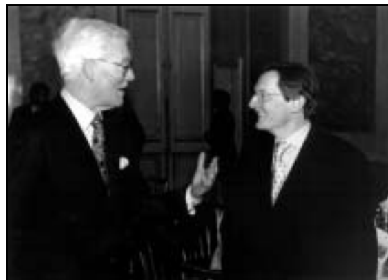
Lord Hurd, Wolfgang Schüssel

Eine rasche Osterweiterung werde eher durch EU-interne Probleme gebremst denn durch die Kandidaten selbst. Dies war der Tenor unter den Teilnehmern des Club of