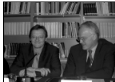
Wolfgang Schüssel, Jürgen Rüttgers

Are there criteria to discern a conservative party from a social-democrat or a liberal party today? Andrzej Olechowski (Chairman, "Civic Platform", and former Polish Minister of Foreign Affairs), Jürgen Rüttgers (Deputy Chairman, CDU, and former German Federal Minister of Education, Science, Research and Technology) and Wolfgang Schüssel (Federal Chancellor of the Republic of Austria) exchanged their views on November 26, 2001. See also Jürgen Rüttgers' commentary on page 25.