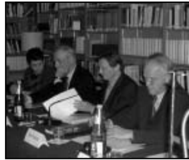
Andrzej Olechowski, Wolfgang Schüssel, Jürgen Rüttgers

Wolfgang Schüssel, Bundeskanzler der Republik Österreich und Parteivorsitzender der ÖVP, betonte ebenfalls die Entwicklung des Europagedankens durch Christdemokraten. Das vereinte Europa sei als Antithese zum Krieg, zur Feindschaft zwischen den Völkern konzipiert worden. Tatsache sei, dass heute alle Parteien versuchen, den Ausgleich zwischen polarisierenden Positionen zu finden und zur Mitte streben. Dennoch bestünden signifikante Unterschiede, die sich an einigen wenigen Grundsatzfragen zuverlässig manifestieren: Eine solche sei der Begriff der Heimat, eine andere die Familienpolitik. Ebenso erhellend sei das Verhältnis zum und der Umgang mit dem Leben, sei es im Zusammenhang mit dem Thema Abtreibung, sei es im Hinblick auf die Sterbehilfe, aber auch vor dem Hintergrund der neuen Herausforderungen auf dem Gebiet der Biotechnologie.