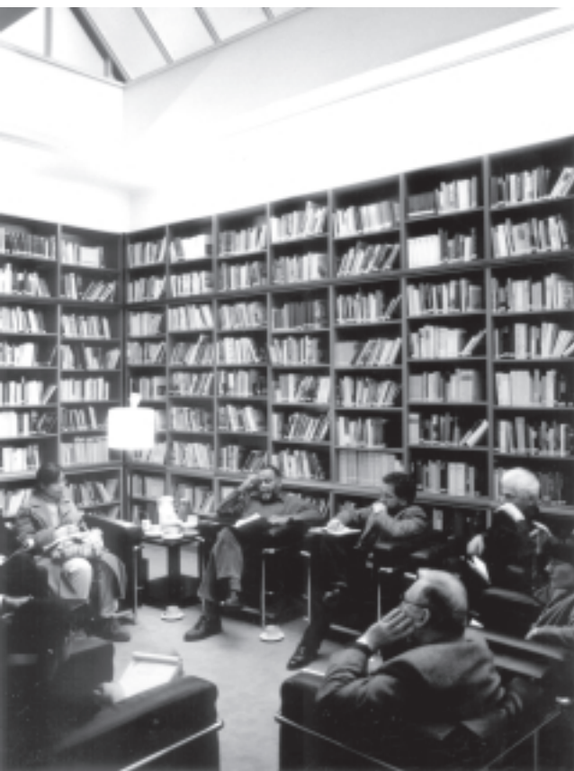
Seminar with Arjun Appadurai, Professor of Anthropology and of South Asian Languages and Civilizations, and Director of the Globalization Project, University of Chicago. He was guest at the IWM in December 1999.