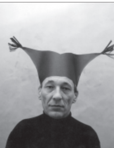
Aus der Serie "Krönungen".