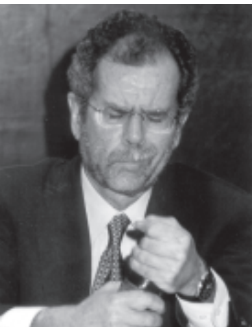
Alexander Van der Bellen