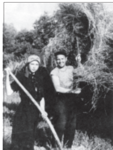
Jan Patocka bei der Heubrigade in den 50er Jahren.

Das neue Forschungsvorhaben versteht sich als Fortführung des Projektes Erforschung und Publikation des philosophischen Werks von Jan Patocka , das ebenfalls vom FWF gefördert wurde und in dessen Rahmen 1984 begonnen wurde, das Oeuvre des tschechischen Philosophen zu sammeln und zu erschließen. Das hierzu gegründete Patocka-Archiv des IWM enthält heute