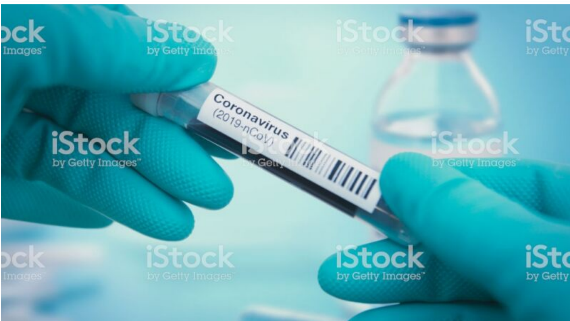
Die Covid-19-Pandemie hält sprichwörtlich die ganze Welt in Atem. Noch nie in der Menschheitsgeschichte gab es wegen eines Virus so weitreichende globale Maßnahmen